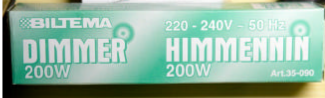
Originalkartongen med artikelnummer